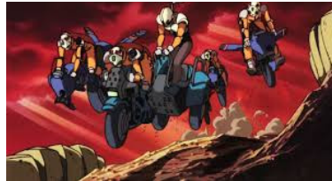
L'équipe des Black Manta en pleine course

blindés sur la piste de course. La silhouette menaçante d'un Juggernaut HAVw A5 l'est toujours autant depuis la Guerre des Clones et personne n'osera braver sa puissance de feu !