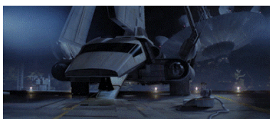
La navette de la juge Danatova avant son départ.

La nouvelle est tombée ! Les autorités impériales confirment la mort de la juge Laïlal Danatova, 55 ans, mère de 3 enfants et enfant chérie de Montellian Serat. Elle a été cruellement assassinée il y a 3 jours par une équipe de vils terroristes rebelles alors que sa navette était en transit pour Xarlunet où elle devait juger un pirate capturé pour un horrible double meurtre. Le gouverneur Harakk a fortement condamné cet assassinat et offre une prime de 2500 crédits impériaux à quiconque pourrait aider à la capture des rebelles assassins. Rappelons que la navette transportait également 3 braves pilotes impériaux ainsi que 2 gardes du corps de l'armée impériale, morts dans l'exercice de leurs fonctions. Seul un des deux droïds de protocole embarqués a pu être récupéré mais aucune information vitale concernant cette attaque n'y a été découverte.