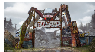
L'entrée de la décharge de Wark City.

Les habitants de la banlieue chaude de Wark City se sont posés des questions en voyant une colonne de flammes s'élever brusquement de la décharge à l'est de la ville il y a 2 jours. Le crime organisé est habituellement relativement discret sur place, bien que sévèrement contrôlé par les autorités. En effet, les habitants signalaient des échanges de coup de feu et des explosions. Craignant une guerre des gangs une division de policiers de la Force de Sécurité de Wark City, épaulés par un détachement de soldats de l'armée impériale et de deux marcheurs de combat NR-TT, se sont quand même rendus sur place par précaution. Quelle ne fut pas leur surprise d'y découvrir des bungalows ayant servi à des passes de prostitution. Des dizaines de gangsters locaux ont été retrouvés sur place, abattus par une force adverse inconnue qui au passage s'est emparée du contenu de leurs coffres-forts. Les enquêteurs de la Force de Sécurité ne savent pas quoi penser de cette histoire. Aucune trace à ce jour des prostituées. La police locale a dépêché une brigade spéciale pour les retrouver et les libérer si jamais elles étaient captives d'un autre gang. Soyons certains que cette affaire fera parler d'elle !